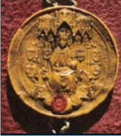
Sigillo di Sua Maestà Federico III, controsigillato con l'anello per indicare l'intervento personale del sovrano

Dal VII millennio a.C. ai giorni nostri, in Europa e in tutto il mondo conosciuto, esiste una continuità ininterrotta nell'uso dei sigilli. L'universalità di utilizzo e l'estensione temporale di 9000 anni in civiltà così diverse dimostrano l'eccezionale rilevanza storica e antropologica di questi piccoli oggetti. Essi rappresentano non solo una forma di