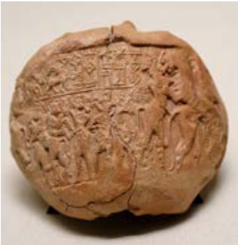
Cretula di argilla con impresso il sigillo di Lugalanda, uno degli ultimi re della I dinastia di Lagash. Prima dinastia III (circa 2400 a.C.). Rinvenuta a Telloh (antica Girsu)

M a cos'è un sigillo e qual è il suo messaggio?