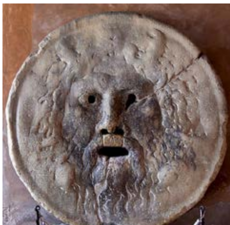
Simbolo di autenticità e trasparenza. Così come la bocca della verità, il sigillo certificato porta Verità e smaschera il bugiardo.

Io, l'olivettiano, non potevo tuttavia sapere che, dopo innumerevoli tentativi, quel giorno avrei dato una svolta alla mia vita professionale.